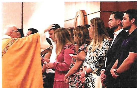
I catecumeni ricevono il segno della croce sulla fronte, segno dell'amore e della vittoria di Cristo.