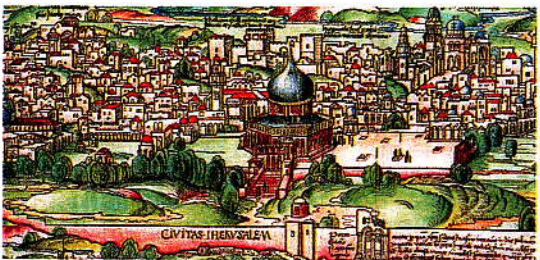
Mapa della città di Gerusalemme, da "Peregrinatio in Terram Sanctam" di Bernhard von Breydenbach (1440-1497). Acquaforte di Erhard Reuwich (ca.1488).